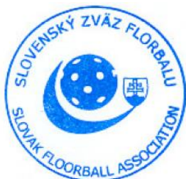
Oto Divinský prezident Slovenského zväzu florbalu