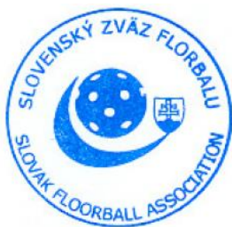
Oto Divinský prezident Slovenského zväzu florbalu